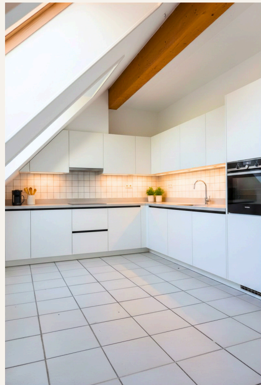
Küche (digitales Staging)