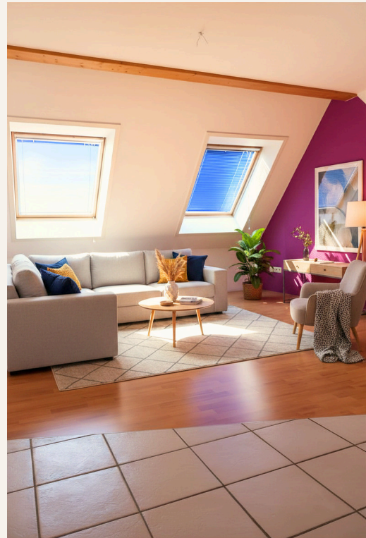
Wohnzimmer (digitales Staging)