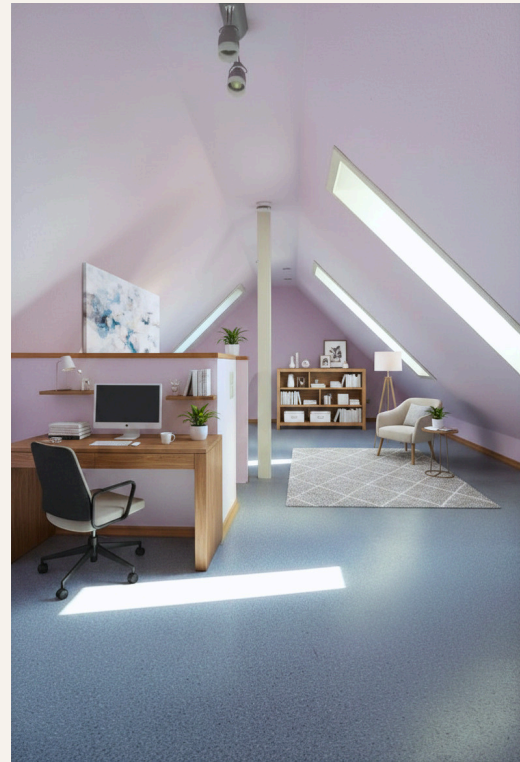
Galerie (digitales Staging)